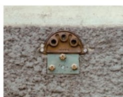
Plaque 3 trous ø 14 Buse ø 2,7