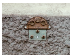
Plaque 3 trous ø 20 Buse longue ø 4