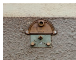
Plaque 1 trou ø 14 Buse courte ø 4